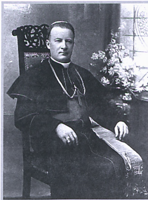
Św. Józef Bilczewski – bp ordynariusz lwowski

Jak wiemy wraz z 11 listopada 1918 r. nie nastąpił długo wyczekiwany pokój i pomyślność ojczyzny. O jej realną wolność, o jej granice walki toczyły się jeszcze przez kilka następnych lat. Jednym ze szczególnych regionów, od wieków związanych z Polską, który musiał zmierzyć się z bojem o przynależność do ojczyzny – była Ziemia Lwowska. Po 11 listopada 1918 r. miasto to nie cieszyło się spokojem, tak jak to było choćby w Ra-