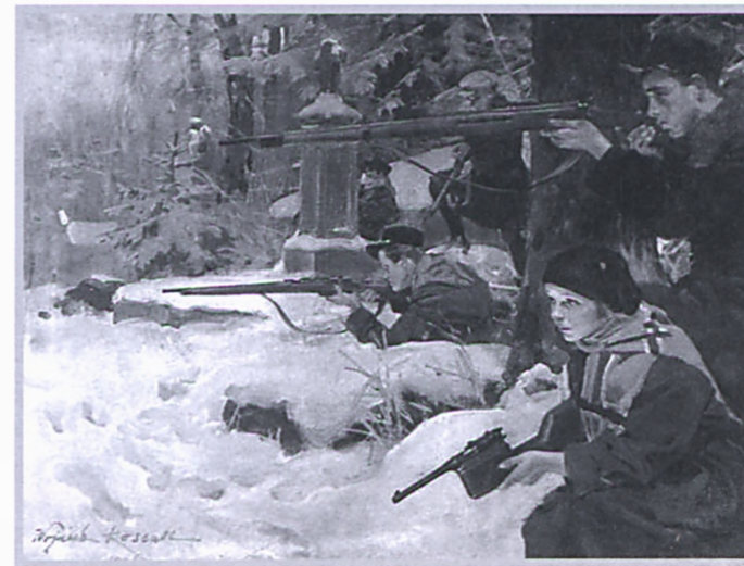
Wojciech Kossak. Orląta – obrona cmentarza