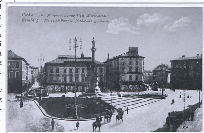
Lwów. Plac Maryacki z pomnikiem Mickiewicza. Bemberg. Maryacki-Platz u. Mickiewicz-Denkmal.

Dar ten ofiarowali lwowskiej Delegacji K. B. K. do rozdawnictwa między najbardziej potrzebujących. Gdy dar ten nadejdzie, wydany zostanie w znacznej części powiatowemu komitetowi ratunkowemu dla ofiar wojny z powiatu lwowskiego, osobliwie z Sokolnik, z którymi delegaci zetknęli się i dowiedzieli się o nader ciężkiej doli wygnańców tej wsi.