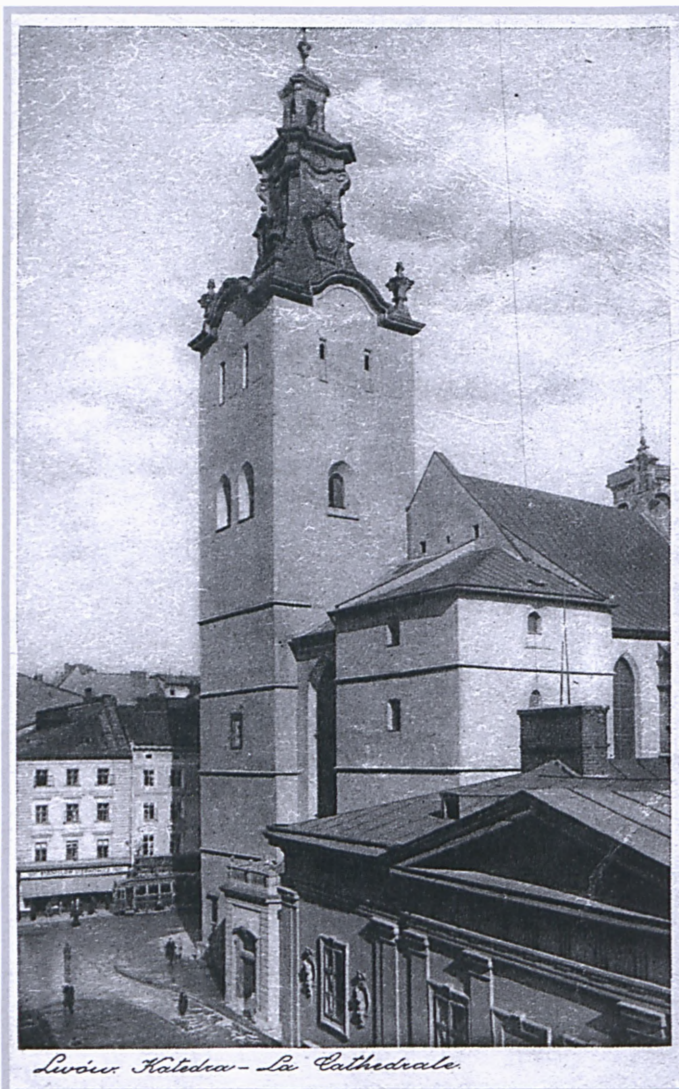
Lwów – Bazylika archikatedralna Wniebowzięcia NMP