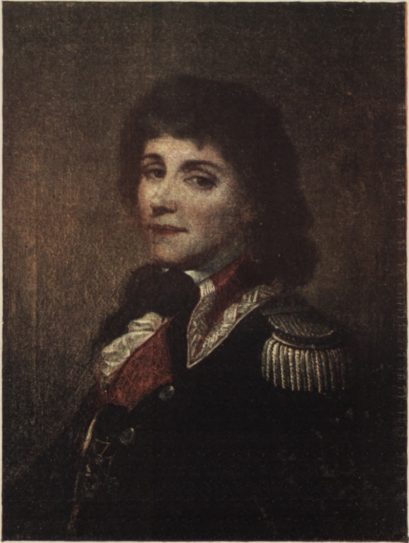
Tadeusz Kościuszko, w mundurze general-majora wojsk koronnych.