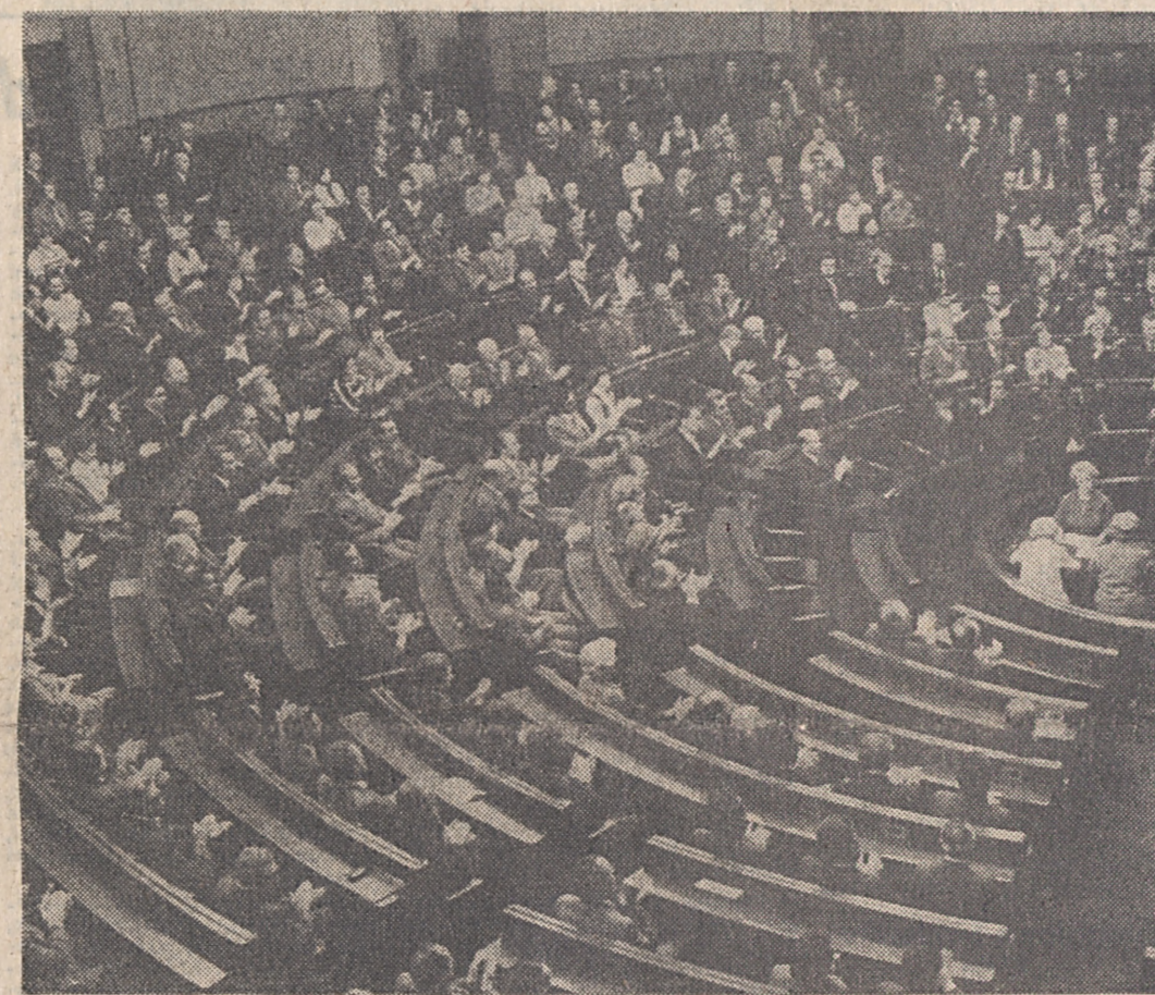
(P) Podczas posiedzenia