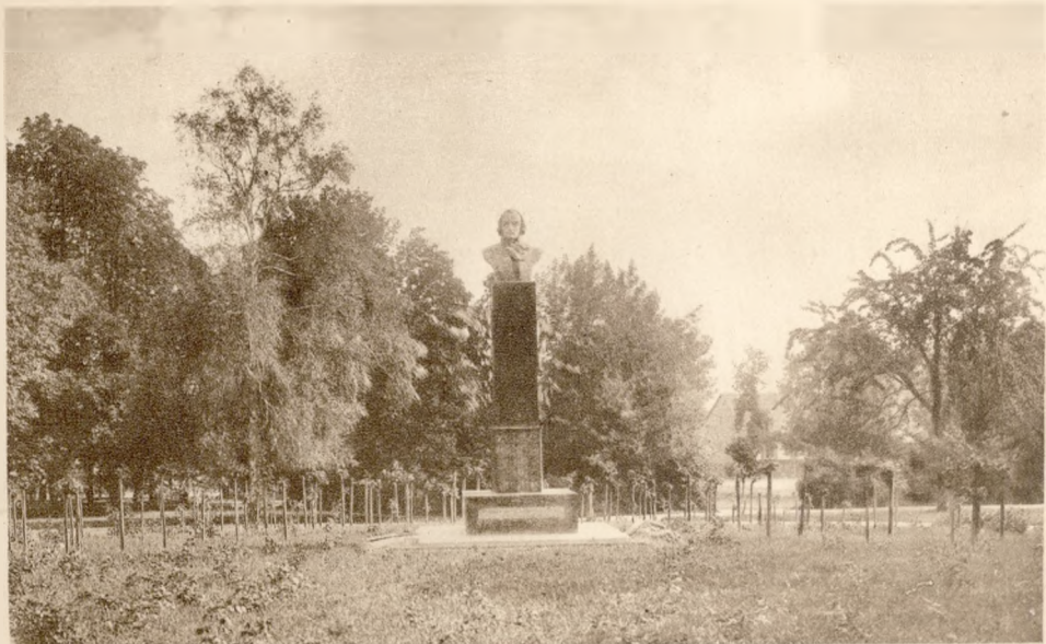
CZĘSTOCHOWA. Pomnik Puławskiego w Parku 3-go Maja.