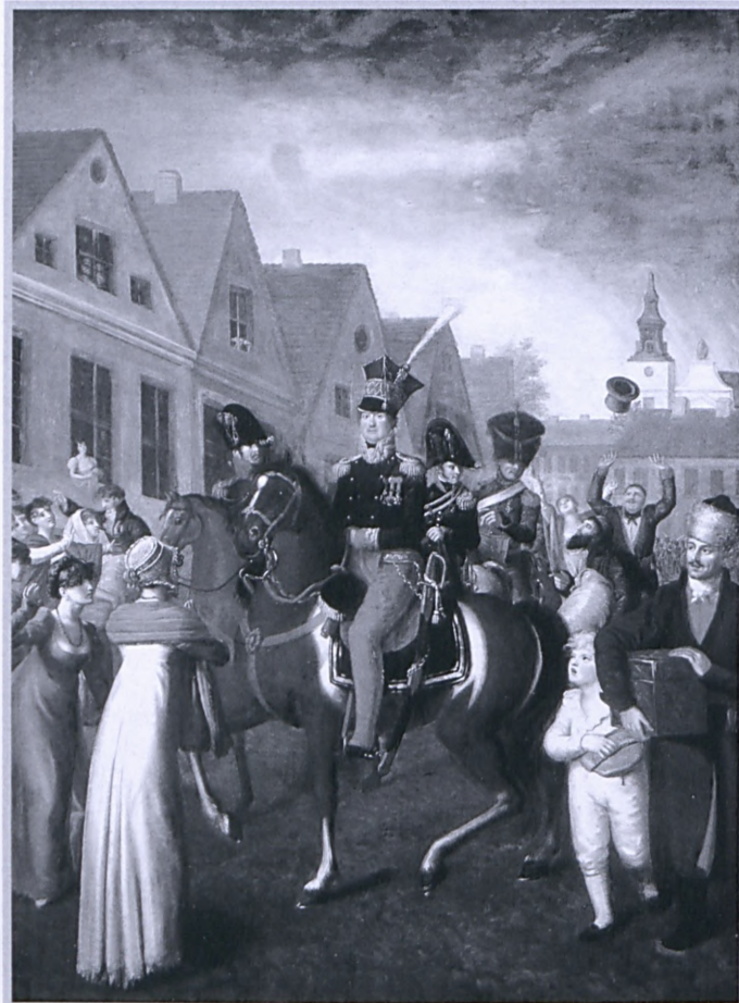
Wjazd do Poznania w 1807 r.

Nasze zwycięstwo taktyczne w bitwie pod Raszynem, które uchroniło Wojska Polskie przed rozbięciem, a także możliwość bronięcia się w Warszawie, były silnymi argumentami w negocjacjach pomiędzy dowódcami obu wojsk, do których doszło po bitwie. Jednakże, Książę Józef zaproponował oddanie Warszawy bez walki, prosząc w zamian tylko o możliwość bezpiecznego przejścia Wojsk Polskich na wschodnią stronę Wisły. Na szczęście arcyksiążę Ferdynand d'Este nie zauważył podstępów i wyraził zgodę i od tej pory, aż do końca wojny, Wisła, przez którą Austriacy nie mieli jak się przeprawić na wschód, stała się naturalną przeszkodą uniemożliwiającą dopadnięcie i rozbięcie słabszych Wojsk Polskich. Natomiast, Warszawa stała się „więzieniem” dla Austriaków, gdyż warszawiacy okazali wrogość i stało się jasne, że gdyby wojska austriackie opuściły Warszawę, aby podbić resztę