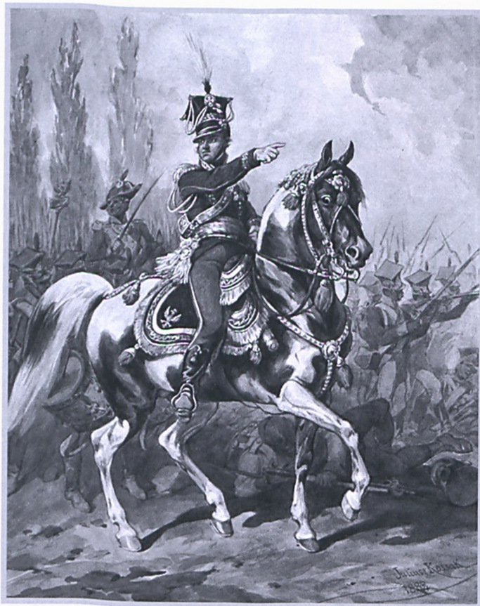
Legiony Polskie we Włoszech

też okazją, aby przynajmniej niektórzy mężczyźni zamieszkaujący w Jedlni zgłosili się na ochotnika do służby w Wojskach Polskich. Przez Kozienice (2 lipca 1809 r.) i Jedlnię (2/3 lipca 1809 r.) dotarł dnia 3 lipca 1809 r. do Radomia entuzjastycznie witany przez mieszkańców,