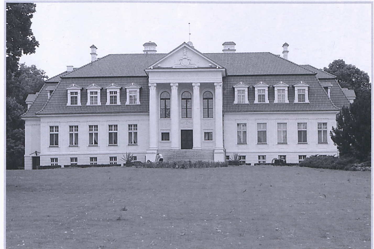
Winna Góra – nowy pałac wzniesiony przed 1910 r. w miejsce starego

Wobec tego „uziemiony” w Warszawie arcyksiążę Ferdynand wysłał kilka mniejszych oddziałów, aby spróbowały zdobyć kilka miast polskich, ale nie przyniosło to efektów, a w dodatku, zewsząd docierały wiadomości złowrogie dla Austriaków. Przede wszystkim, okazało się, że Wojska Polskie pod wodzą Księcia Józefa, po przejściu przez Wisłę odbiły z rąk austriackich Lubelszczyznę, Zamojszczyznę i Sandomierz. Ponadto, Generał Dąbrowski w Wielkopolsce zorganizował z ochotników dywizję liczącą ok. 7 tys. żołnierzy i zaczął wypierać oddziały austriackie, zbliżając się w stronę Warszawy. Natomiast, na froncie południowym okazało się, że Napoleon Bonapar-