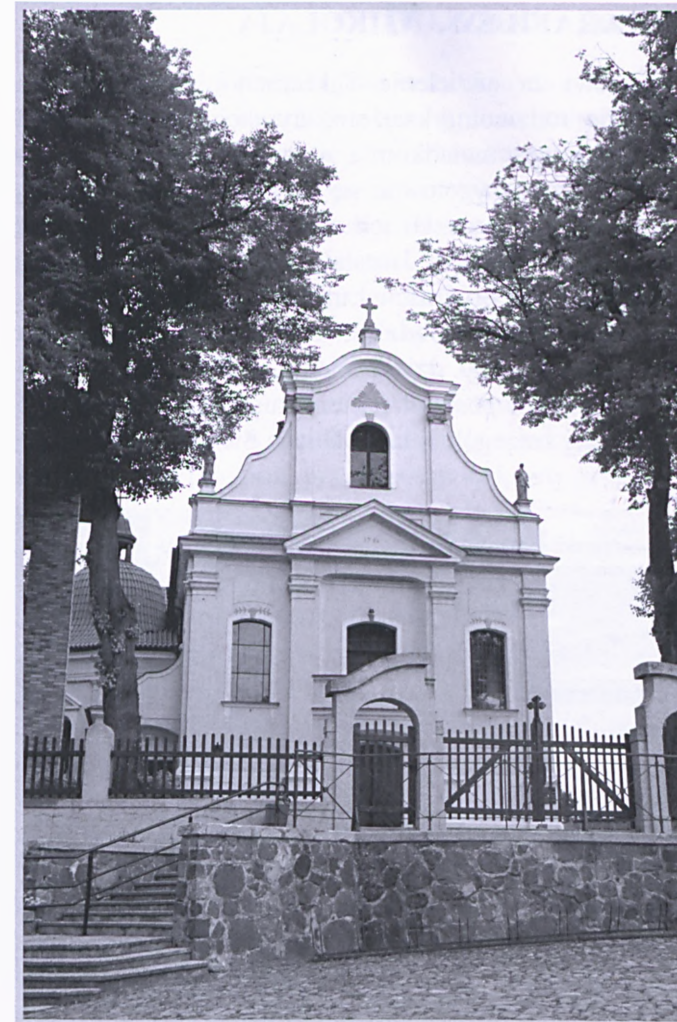
Winna Góra – kościół