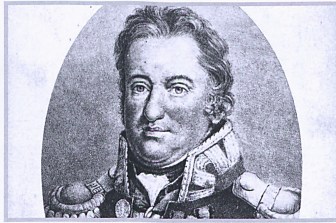
General Jan Henryk Dąbrowski

Wszystko zmieniło się dopiero w 1809 r., gdy Austria zaatakowała Francję, oraz jej sojuszników, czyli Saksonię i Księstwo Warszawskie, do którego, armia austriacka wkroczyła 15 kwietnia 1809 r. i ruszyła prosto na Warszawę. Olbrzymia dysproporcja sił pomiędzy wojskami wróżyła naszą rychłą klęskę, gdyż oddziały austriackie liczyły ok. 31 tys. żołnierzy, zaś nasze wojsko, które mogło wyjść w pole, składało się zaledwie z ok. 14 tys. żoł-