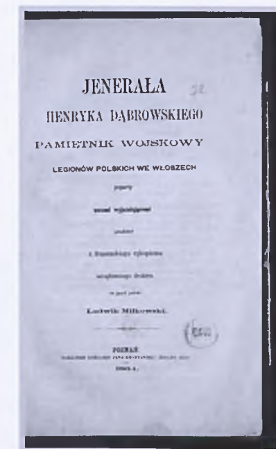
Pamiętnik autorstwa J.H. Dąbrowskiego

Wobec tego, Książę Wódz Józef Poniatowski podjął decyzję o wkroczeniu polskiej armii do Zach. Małopolski w celu wyparcia wszystkich wycofujących się oddziałów austriackich i zarządził koncentrację Wojsk Polskich w Radomiu. Stąd też, dnia 30 VI 1809 r. Pan Generał poprowadził trzon swej dywizji liczący ok. 4 tys. żołnierzy z Tarczyna, przez War-