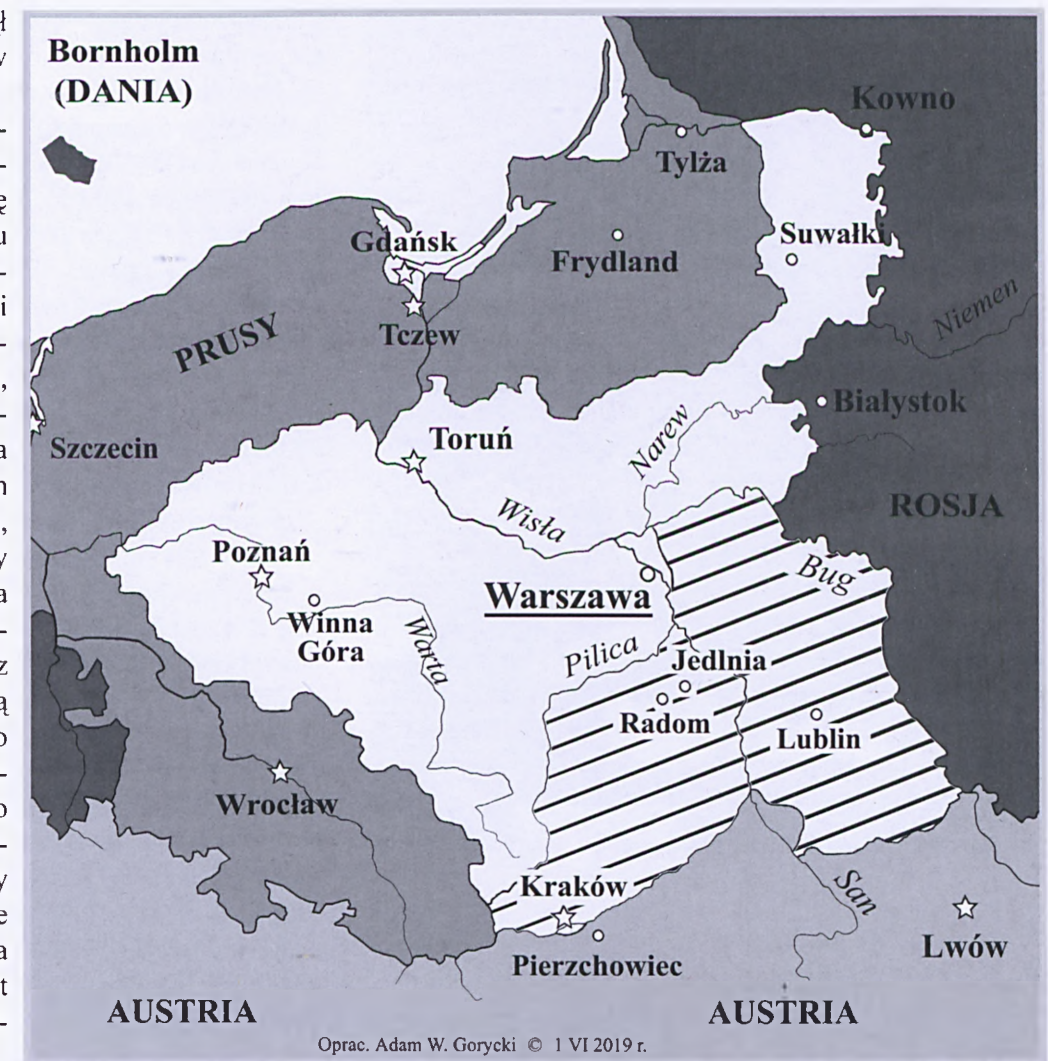
Mapa „Księstwa Warszawskiego w 1809 r.” (1) liniami ukośnymi oznaczono ziemie, które zostały odbite podczas wojny polsko-austriackiej w 1809 r. z rąk austriackich i przyłączone do Księstwa Warszawskiego na mocy traktatu pokojowego zawartego w Schönbrunn dnia 14 października 1809 roku; (2) gwiazdkami oznaczono ważniejsze twierdze i miasta warowne

kę (30 czerwca/1 lipca 1809 r.), do Ryczywołu (1/2 lipca 1809 r.), a ponieważ nie napotkał żadnego oporu ze strony wroga, więc ruszył w stronę Radomia.