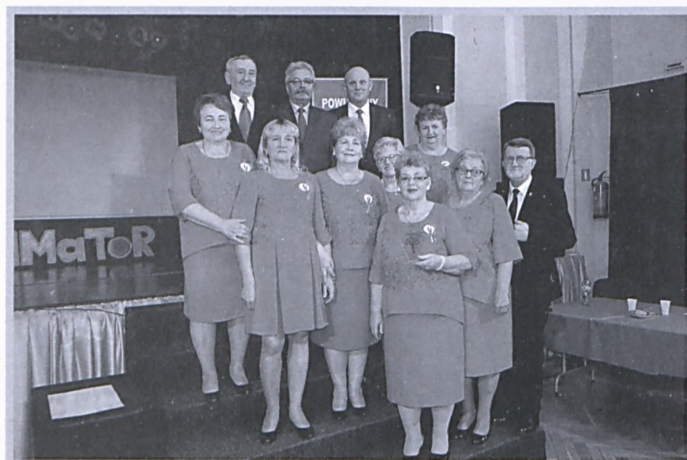
Zespół „Półborzanki” z Augustowa