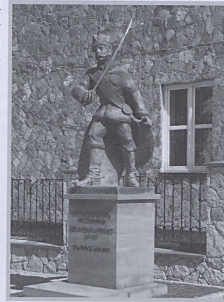
Pomnik gen. Mariana Langiewicza w Wąchocku

– To wszystko, powodzenia panie poruczniku!