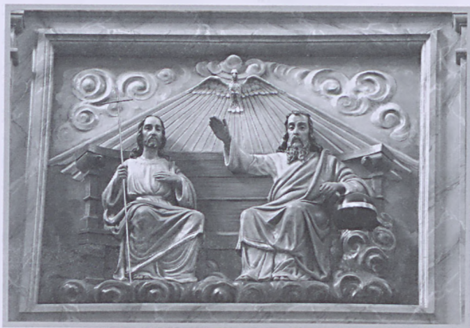
Plaskorzeźba nad ołtarzem głównym z kościoła w Jedlni

To pozdrowienie Apostoła Pawła niech będzie pozdrowieniem wszystkich Parafian i zaproszeniem do pogłębienia wiary i wzrostu w łasce Bożej. Wierzyć bowiem, to znaczy widzieć rzeczywistość doczesną tak, jak widzi ją Bóg.