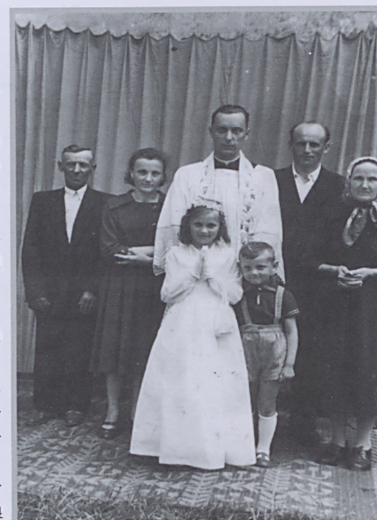
Zdjęcie podpisane przez ks. Warchola: od lewej strony mój Tatus i moja Siostra, po prawej mój Szwagier i moja Mamusia, przede mną moja Siostrzenica i mój Siostrzeniec (wspomina ks. Edward).

głem do sąsiadów, schowałem się do piwnicy. Dla większego bezpieczeństwa wszedłem do drewnianej beczki i jeszcze czymś się przykryłem (wspomina). Tak bardzo się bał i tak bardzo chciał żyć.. Przypomina sobie również jak jego Ciocia przybiegła do domu, schowała się w komorze, a tam, by bardziej czuć się bezpieczną, weszła pod łóżko. Krótko mówiąc: panowała ogólna panika, dezorientacja i przerażenie.