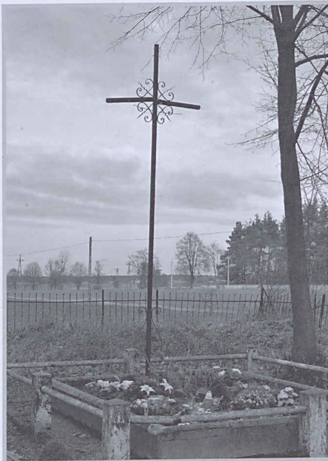
Mogila powstańcza na starym cmentarzu, widok sprzed 2008 r.

Poczem poszły słowa przyciszone upojne, tłumione przez śnieg ścielący się po ziemi i cisze nocną.