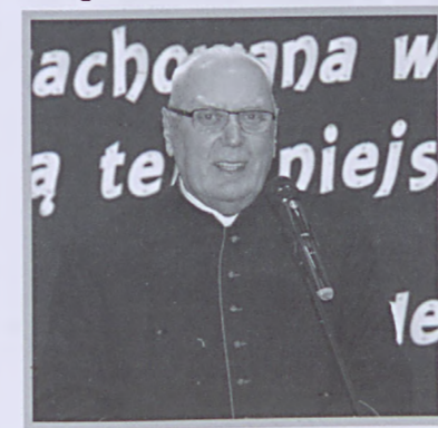
Najstarszy z obecnych na jubileuszu 200-lecia szkoły w Jedlni

Najwcześniejszym wydarzeniem, które nim wstrząsnęło i głęboko wbiło się w jego pamięć był dzień wybuchu