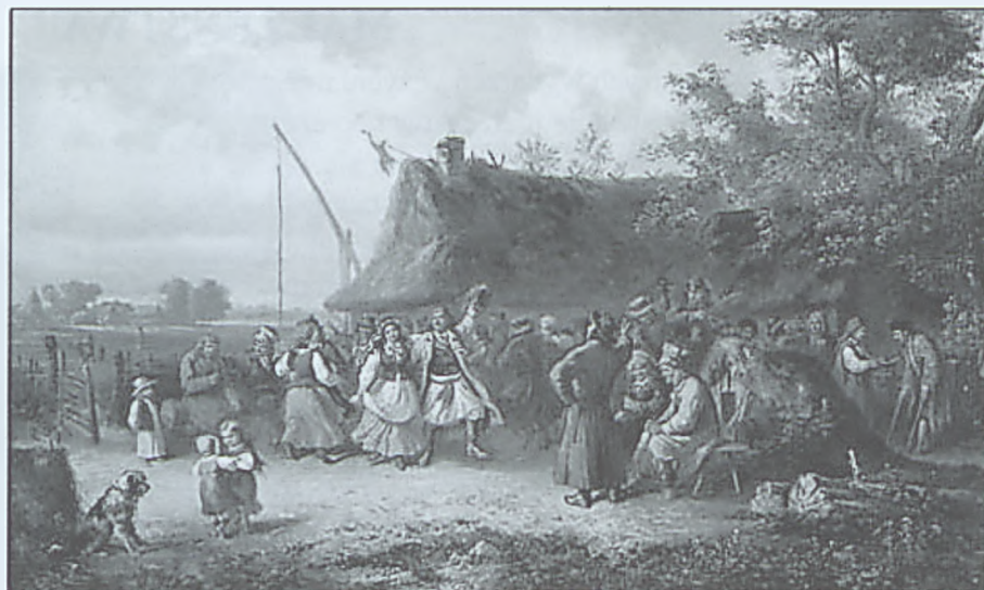
Franciszek Kostrzewski - „Wesele wiejskie z okolic Warszawy”, 1865r. olej na płótnie. (ur. Warszawa 19 kwietnia 1826 - Warszawa 30 września 1911)