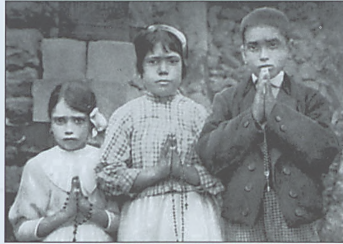
Pastuszkowie z Fatimy

W pierwszej części tajemnicy fatimskiej Matka Boża ukazała dzieciom przerażającą wizję piekła. W ten sposób przypomniała prawdę Ewangelii, że odrzucając Boga, człowiek wybiera piekło. Największym nieszczęściem, jakie może spotkać człowieka, jest więc wieczne potępienie. Z własnej winy można doprowadzić siebie do takiej zatwardziałości serca, że znienawidzi się Boga i w chwili śmierci świadomie wybierze piekło. Pierwsza tajemnica