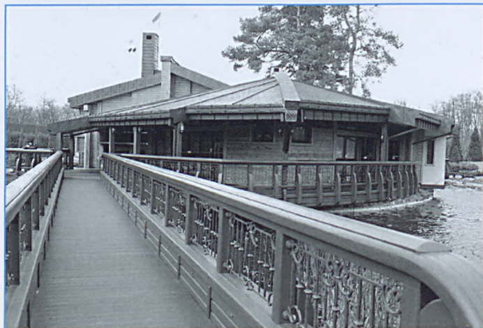
Sauny z domkami do picia herbaty na sztucznej wyspie