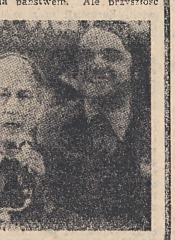
Dwaj antagoniści. Z lewej premier Kanady — Pierre Trudeau, z prawej, przed mikrofonem szef lokalnego rządu prowincji Quebec — Rene Levesque.

Premier rządu federalnego w Ottawie — Pierre Trudeau — sam zresztą pochodzący z Quebecu — uważa, iż może zapobiec niepodległościowym dążeniom wladz tej frankońskiej prowincji.