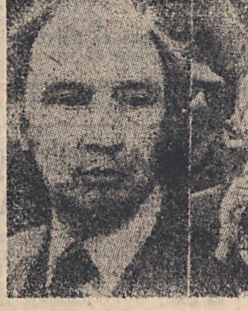
Dwaj antagoniści. Z lewej premier Kanady — Pierre Trudeau, z prawej, przed mikrofonem szef lokalnego rządu prowincji Quebec — Rene Levesque.

programu wyborczego, wielką pomocą w wygranym wyborach przez Partię Quebecu odegrał oskarżenie poprzedniego rządu prowincji utworzonego przez liberałów.