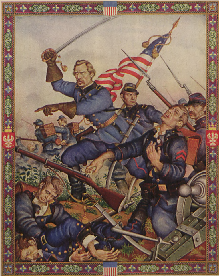
A. Szyk pinx.

Vladimir Krzyżanowski in the battle of Cross Keys. Włodzimierz Krzyżanowski pod Cross Keys.