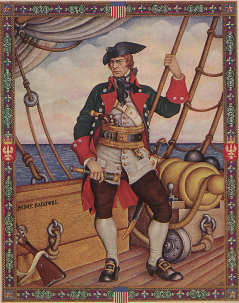
A. Szyk pinx.