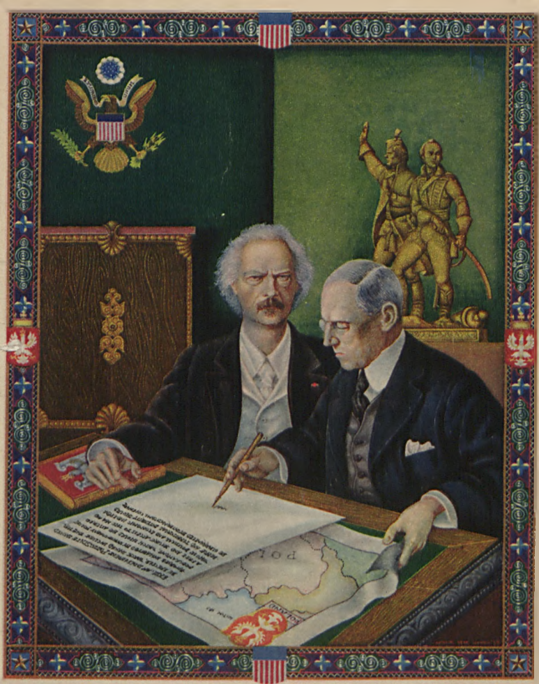
A. Szyk pinx.