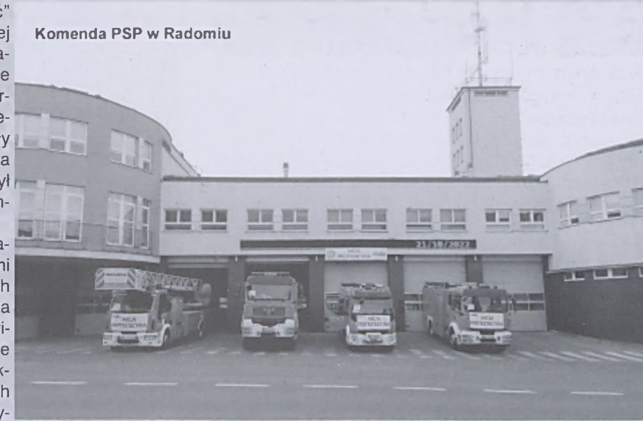
Komenda PSP w Radomiu

Zgodnie z uchwałą do 17 listopada, a więc do dnia ogólnopolskiej manifestacji w Warszawie struktury NSZZ „Solidarność” będą kontynuowały dotychczasową formę protestu. Jeżeli manifestacja nie doprowadzi do przełomu w rozmowach z rządem Krajowa Sekcja Pożarnictwa NSZZ „Solidarność” wprowadzi w życie kolejne kroki protestu. Nowe formy protestu będą ogłaszane sukcesywnie przed ich wdrażaniem.