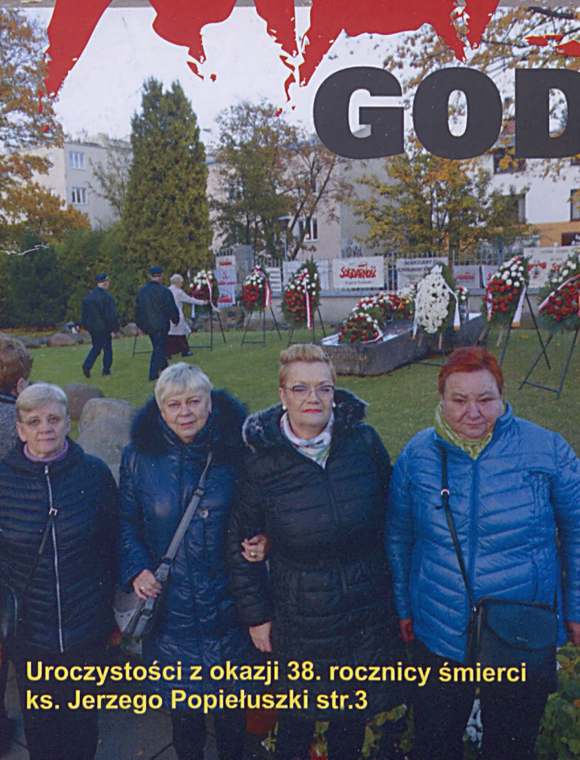
Uroczystości z okazji 38. rocznicy śmierci ks. Jerzego Popiełuszki str.3