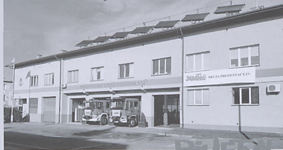
Komenda PSP w Białobrzegach