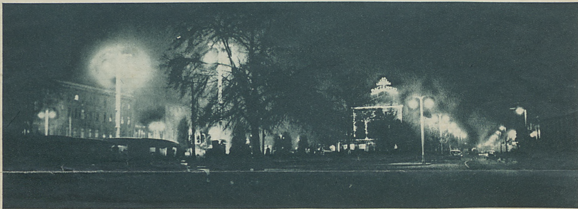
Jak Poznań uczcił 50-lecie żarówki. W 50-tą rocznicę genialnego wynalazku Edisona, plac Wolności w stolicy Wielkopolski z gmachem Polskiego Radja zajaśniał mnóstwem lampek elektrycznych.