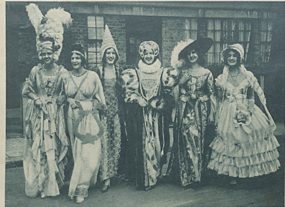
Wielka wystawa fryzur. W Londynie urządzono wielki kongres i wystawę fryzjerską, w której szczególniejszą na siebie zwracają uwagę rozmaite stylowe uczesania głowy według mody z ubiegłych wieków.

„KIRBY SPECIAL” Clemenceau i jego kucharka „Stary tygrys” zmuszony był przenieść się ze swojej letniej siedziby w St. Vincent w Wandei do Paryża z powodu swojej choroby. Tam, w jego majątku dbała o niego przedewszystkiem jego kucharka, której brak niewątpliwie odczuwa dzisiaj w stolicy.