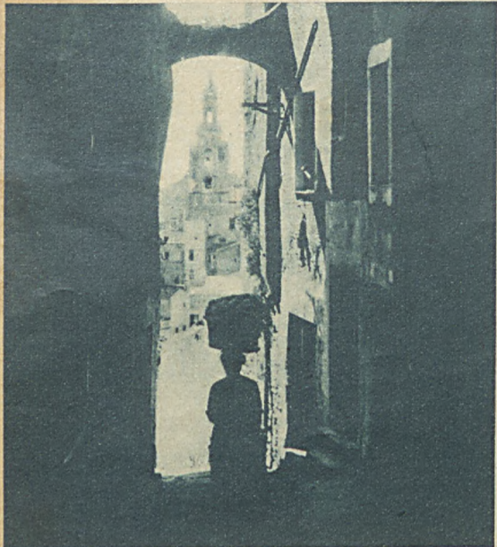
Z malowniczych zaułków zagranicznych. W znanej miejscowości kuracyjnej nad Riwierą włoską, San Remo, jest taka wąziutka uliczka, w której po schodach schodzi się do śródmieścia.