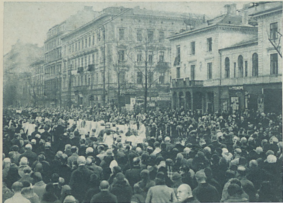
Uroczystość bł. Jana Bosco w Warszawie. Podawaliśmy już sprawozdanie z imponujących uroczystości bł. Jana Bosco w Warszawie. Dla uzupełnienia zamieszczamy obecnie fragment olbrzymiej procesji z relikwiami, przeznaczonymi do rozdania pomiędzy kościoły OO. Salezjanów w Polsce.