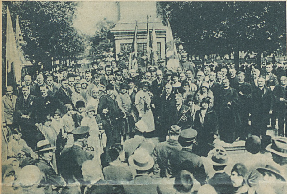
Echa uroczystości Pułaskiego w Ameryce. Z Ameryki do Polski daleka droga, to też dopiero teraz możemy reprodukcować zdjęcie, przedstawiające główne uroczystości ku czci polsko-amerykańskiego bohatera Kaz. Pułaskiego, podczas których obok mowców amerykańskich przemawiał delegat Polski, wybitny powieściopisarz p. Wacław Sieroszewski.