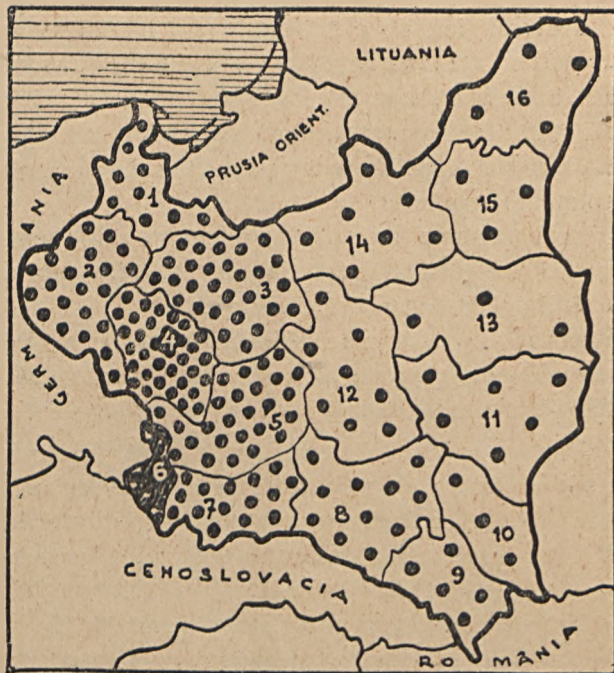
Fig. 2. Răspândirea lucrătorilor industriali în Polonia. 1=Pomerania; 2=Poznan; 3=Varșovia; 4=Lodz; 5=Kielce; 6=Silezia; 7=Cracovia; 8=Lwow (Lemberg); 9=Stanislaw; 10=Tarnopol; 11=Volhynia; 12=Lublin; 13=Polesia; 14=Bialystock; 15=Nowogrodek; 16=Wilna.

bună calitate și folosește mai ales la fabricarea cocsului. Pe lângă huilă, din Polonia se scot și 250.000 tone de lignit. Nu numai că huila și