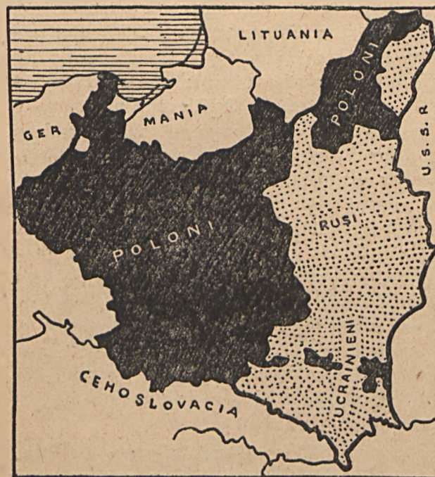
Fig. 4. Populația în Polonia.

Ucrainenii (Ruteni) (peste 7 mil.) locuiesc