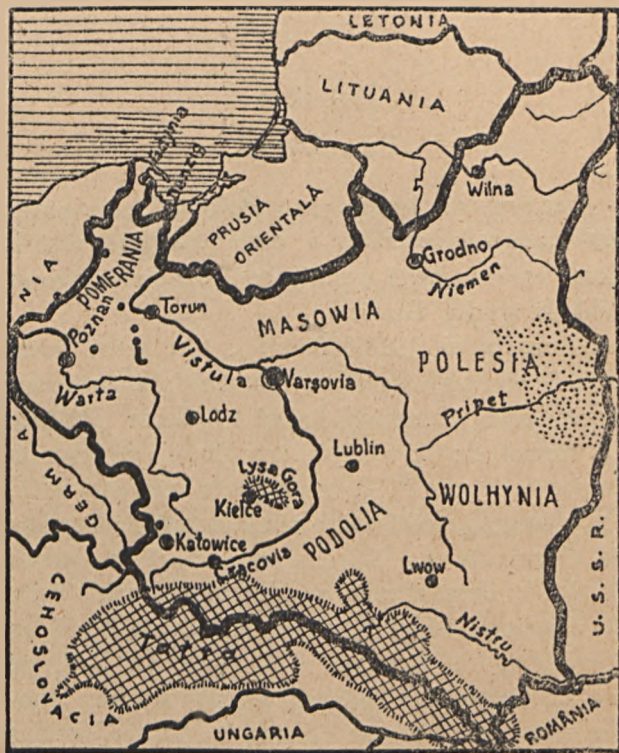
Fig. 1. Harta Poloniei (d. Ahlers)

diș și mâl lăsat de pe urma topirii ghețarilor din vremea Cvaternară. Spre granița de răsărit, se găsesc mlăștinele dela Pinsk din regiu-