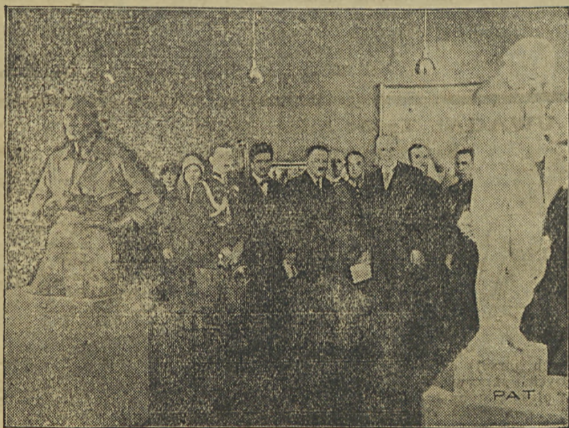
W Kamienicy Baryczków Pan Prezydent Rzplitej dokonał otwarcia Wystawy Listopadowej.