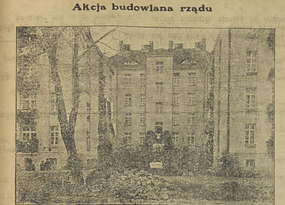
Nowowbudowany okazały gmach mieszkalny dla podoficerów marynarki wojennej w Gdyni.