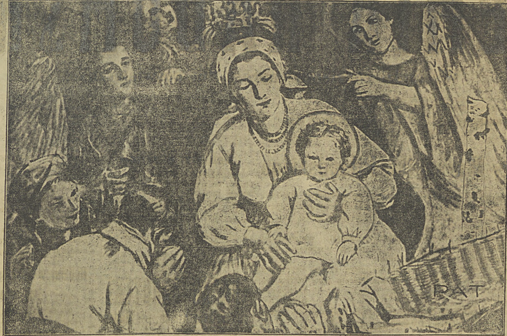
(Reprodukacja obrazu Wodzinowskiego)