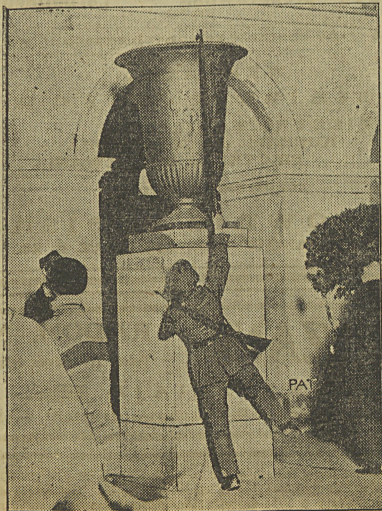
Zapalenie zniczków przed Grobem Nieznanego Żołnierza przez sztafetę w Radzyminie.