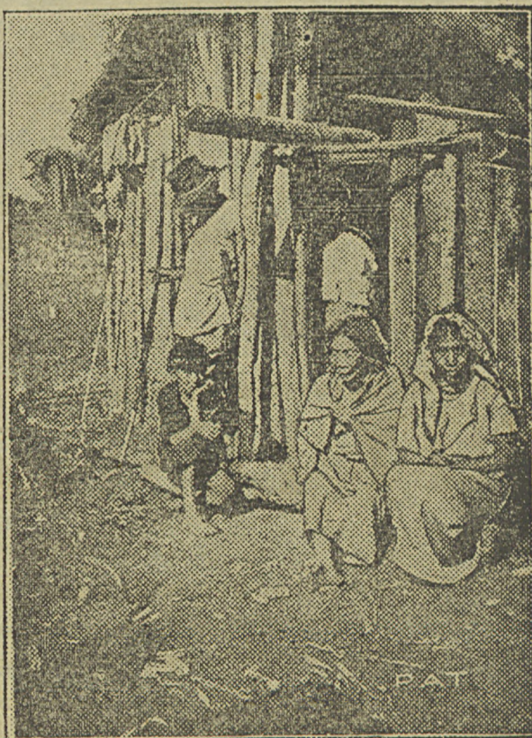
104-roletnia inpjanka szczepu Guarany.