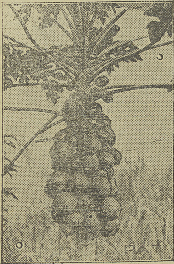
Drzewo dorastające do 22 metrów. Owoce tego drzewa są bardzo soczyste o smaku brzoskwiń. Hodowane są Ameryce.