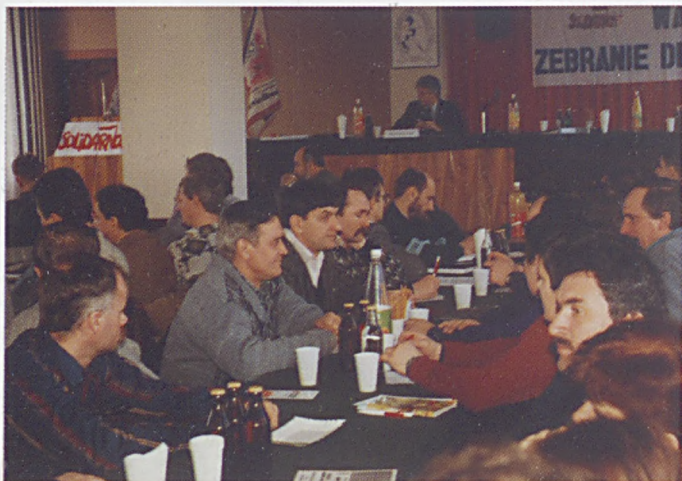
Obrady Walnego Zebrania Delegatów.