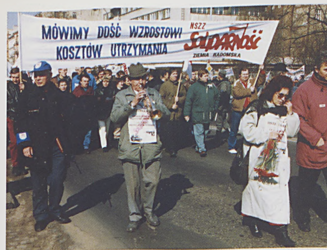
Manifestacja „zbrojeniówki” w stolicy.