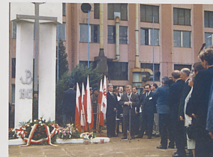
Prezydent Lech Wałęsa z wizytą w ZM „Łucznik”.