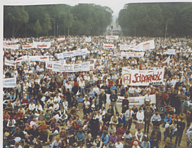
Pielgrzymka Ludzi Pracy na Jasną Górę.