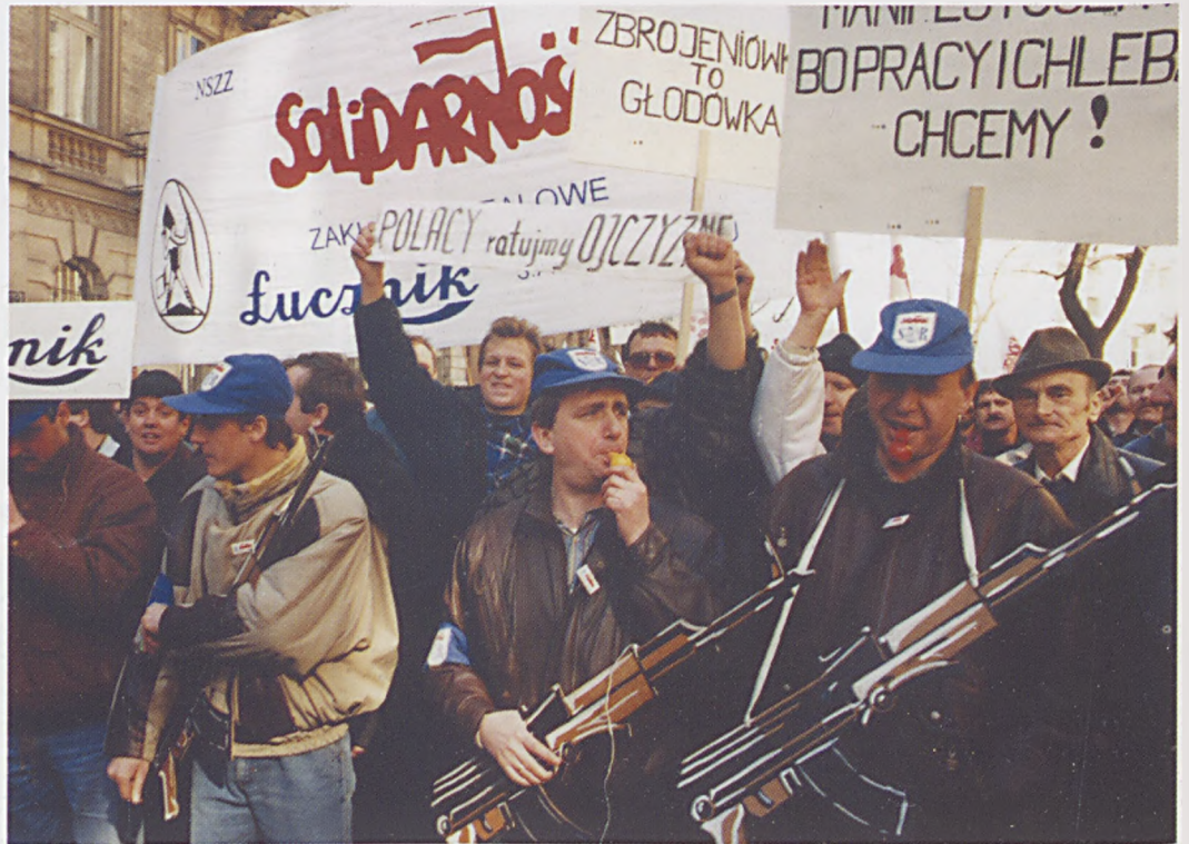
Manifestacja pracowników „Łucznika” w obronie miejsc pracy w Warszawie.