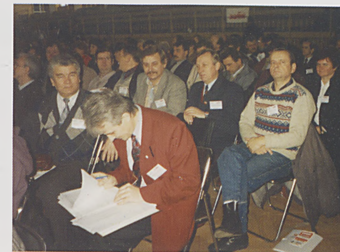
Delegaci „Łucznika” na obradach Walnego Zebrania Delegatów Regionu.