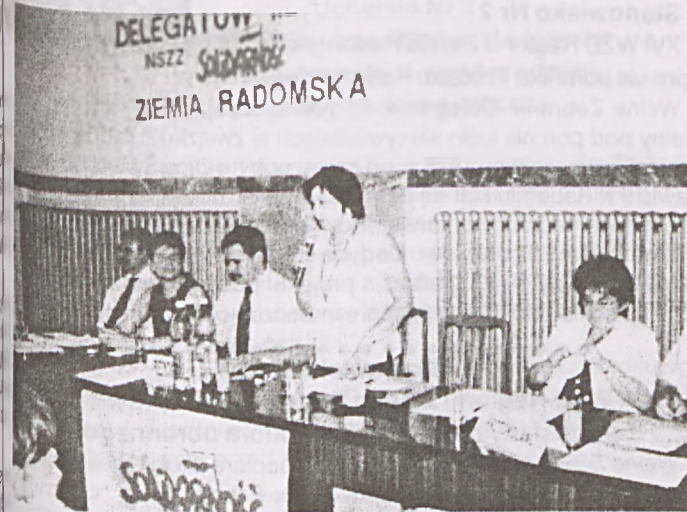
Apel Nr 2