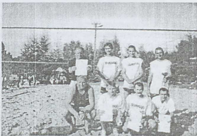
Fot.2 Zwycięzcy turnieju od prawej zdobywcy I,II,III,IV miejsca.