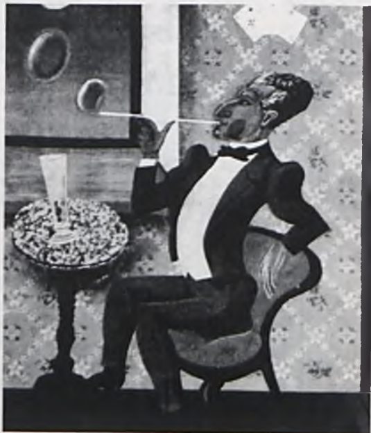
Rysunek Władysława Dąbrowskiego na obwlocie wydania Jarmarku rymów .

6 IV odbywa się prapremiera tragikomedii Tuwima Płaszcz , wg opowiadania Gogola, w teatrze Nowa Komedja.