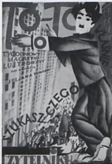
Plakat T. Gronowskiego, Gabinet Plakatów Biblioteki Głównej ASP w Krakowie.

6 XII 1925 – 14 II 1926 redaguje magazyn ilustrowany „To-To”, wydawany wspólnie z M. Grydzewskim i A. Bormanem.