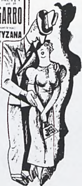
Rysunek Władysława Daszewskiego do wiersza Kartka z dziejów lichobóci .