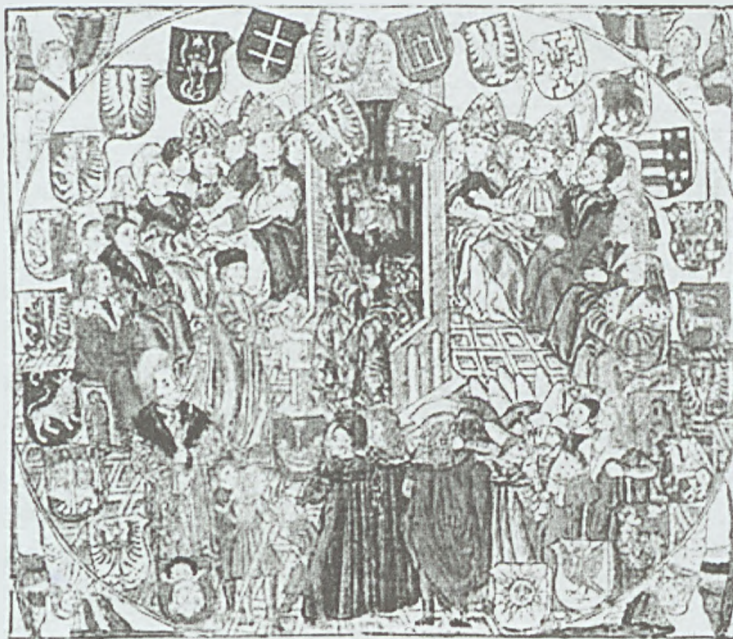
Sejm w Radomiu. Ilustracja ze Statutu Łaskiego.

„Ponieważ prawa ogólne i ustawy publiczne dotyczą nie pojedynczego człowieka ale ogółu narodu, przeto na tym walnym sejmie radomskim wraz ze wszystkimi królestwa naszego praelatami, radami i posłami ziemskimi za słuszne i sprawiedliwe (cd. na str 9)