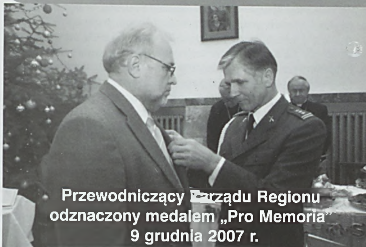
Przewodniczący Zarządu Regionu odznaczony medalem „Pro Memoria” 9 grudnia 2007 r.