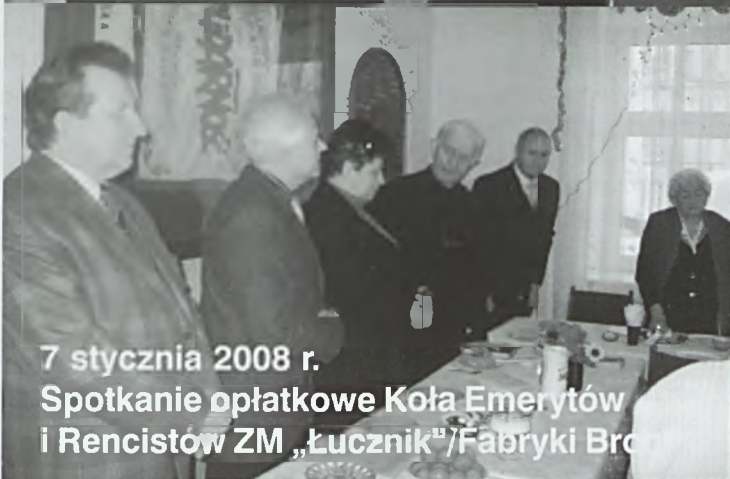
7 stycznia 2008 r. Spotkanie opłatkowe Koła Emerytów i Rencistów ZM „Łucznicz”/Fabryki Bro