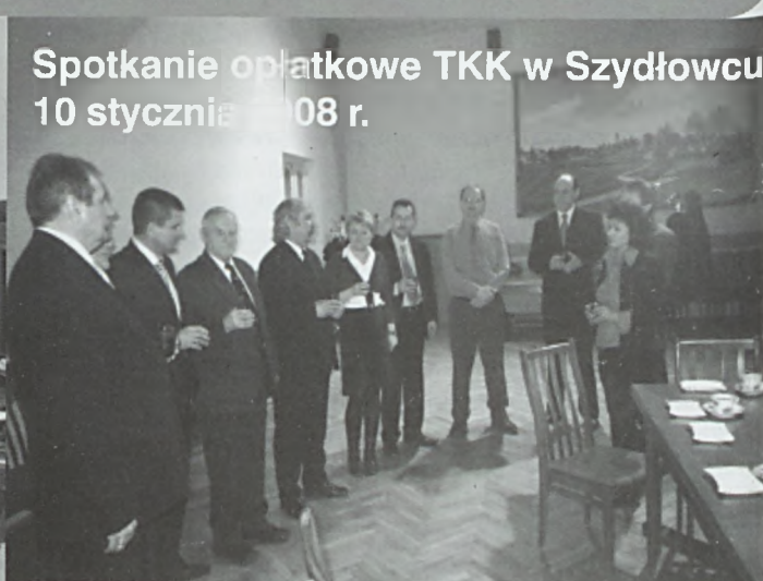
Spotkanie opłatkowe TKK w Szydłowcu 10 stycznia 2008 r.