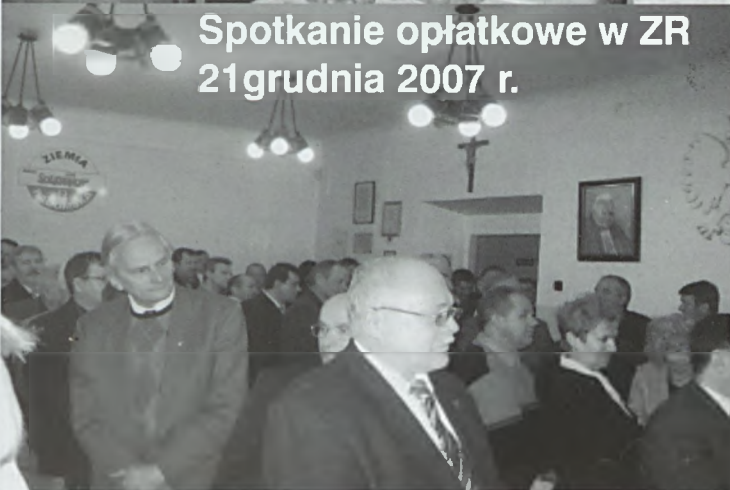
Spotkanie opłatkowe w ZR 21 grudnia 2007 r.