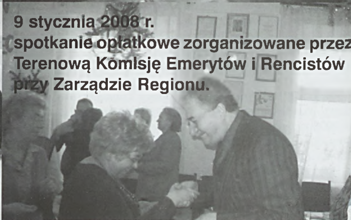
9 stycznia 2008 r. spotkanie opłatkowe zorganizowane przez Terenową Komisję Emerytów i Rencistów przy Zarządzie Regionu.