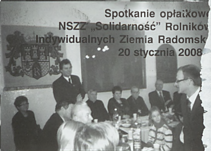
Spotkanie opłatkowe NSZZ „Solidarność” Rolników Indywidualnych Ziemia Radomska 20 stycznia 2008 r.