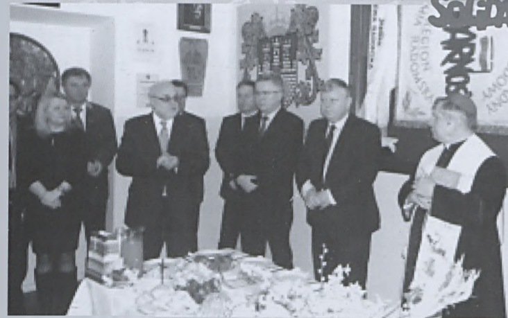
Spotkanie wielkanocne w Zarządzie Regionu - 2016.03.15