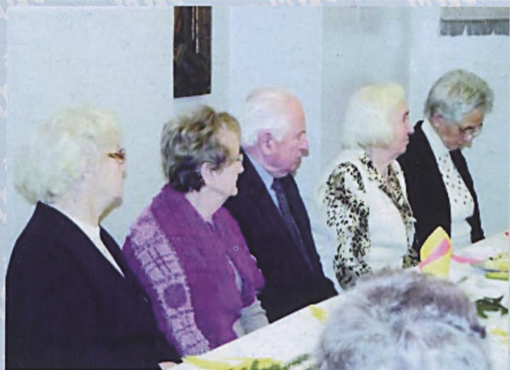
Spotkanie opłatkowe w Komisji Emerytów i Rencistów przy Fabryce Broni - 7 stycznia 2013 r.

Następstwem powstania styczniowego była też likwidacja odrębności i autonomii Królestwa Polskiego. Prowadzono w latach 1864-1876 bezwzględną rusyfikację. Zmieniono nazwę kraju na Przywiślański Kraj i podzielono na 10 guberni. Zlikwidowany został odrębny budżet Królestwa (1866), zamknięto Szkołę Główną w Warszawie (1869), w miejsce, którego utworzono uniwersytet rosyjski. Zakazano działalności oświatowej i kulturalnej w języku polskim, do szkół i urzędów administracyjnych wprowadzono język rosyjski jako język oficjalny. Ostre represje dotknęły również Kościół katolicki i unicki. Dokonano kasacji wszystkich klasztorów w Królestwie, a miastom, które podczas powstania styczniowego czynnie pomagały powstańcom, odebrano prawa miejskie.