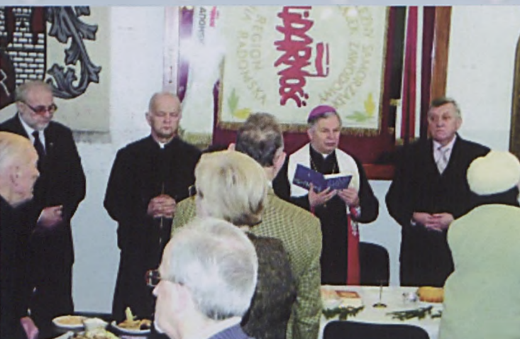
Spotkanie opłatkowe w Terenowej Komisji Emerytów i Rencistów przy Zarządzie Regionu - 9 stycznia 2013 r.