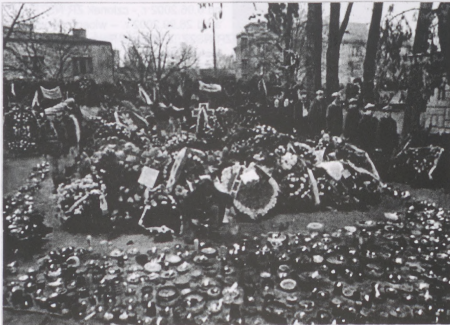
Pogrzeb ks. Jerzego Popiełuszki - 3 listopada 1984 r.