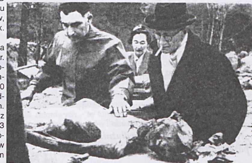
Patolodzy z międzynarodowej komisji ekspertów, która przeprowadziła ekshumację w lesie katyńskim w 1943 r.

Tak historyczna reakcja była pośrednim dowodem na to, że zbrodni dokonał NKWD. Rząd polski w Londynie uznał, że prawda jest najlepszym orężem politycznym i w dniu 15.04.1943 r. postanowił zwrócić się do Międzynarodowego Czerwonego Krzyża w Genewie z prośbą o wyjaśnienie sprawy na miejscu. 17.04 ukazał się oficjalny komunikat rządu RP, w którym poinformowano o zwróceniu się do MCK. Niestety, decyzję tę zrealizowano właśnie 17.04, w dniu, gdy w Genewie znalazła się już podobna prośba niemiecka.