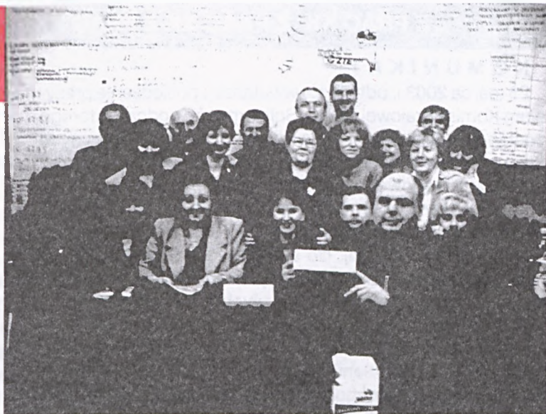
Uczestnicy szkolenia nt. „Prawo pracy po zmianach” Radom 11-13.03.2003 r.