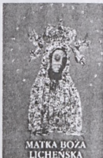
MATKA BOZA LICHENSKA