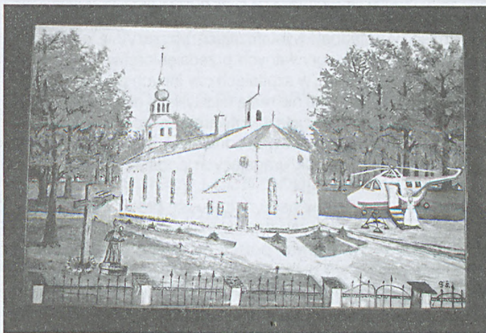
obraz autorstwa p. Śledź